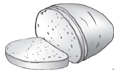
die Scheibe Brot