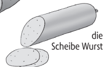
die Scheibe Wurst

Stück 2 ☒ das; -(e)s, -e 1 ein literarisches Werk, das meist im Theater gezeigt wird ≈ Theaterstück, Drama || ☒ Bühnenstück, Fernsehstück 2 ein musikalisches Werk ≈ Musikstück: ein Stück von Chopin spielen || ☒ Klavierstück, Orchesterstück