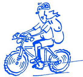
Sie fährt mit ihrem Fahrrad.