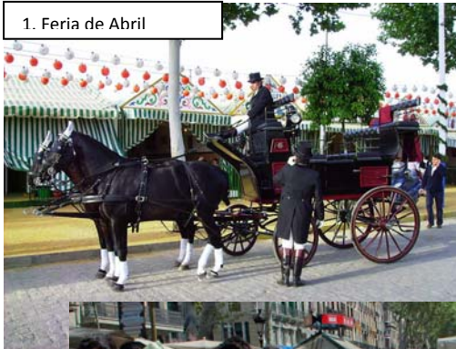
1. Feria de Abril