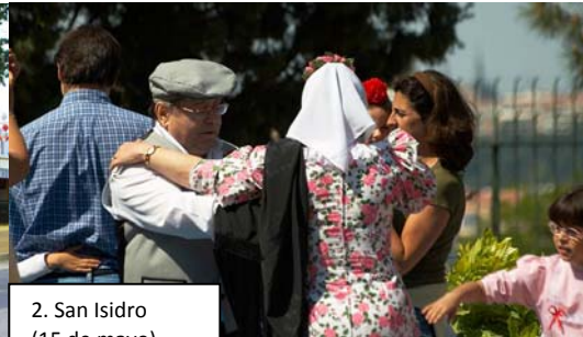
2. San Isidro (15 de mayo)