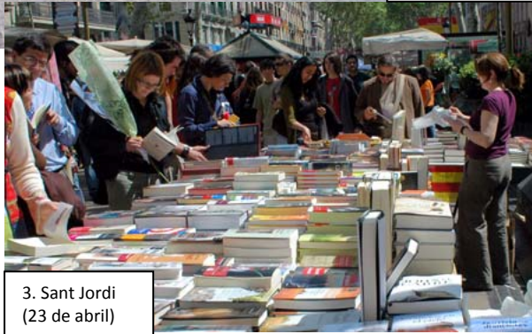
3. Sant Jordi (23 de abril)