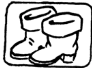
Le Chat botté