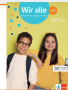
Wir alle A1