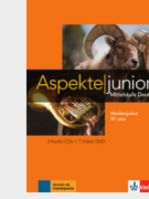
Aspekte junior B1+