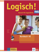
Logisch! neu A2