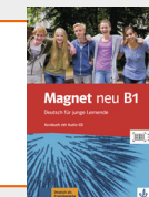
Magnet neu B1