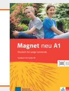
Magnet neu A1