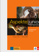
Aspekte junior B1+