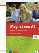
Magnet neu A2