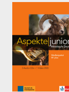
Aspekte junior B1+