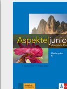
Aspekte junior B2