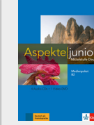
Aspekte junior B2