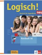
Logisch! neu A1