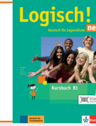
Logisch! neu B1