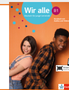
Wir alle B1