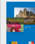
Aspekte junior B2