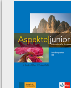
Aspekte junior B2