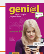
geni@l klick B1