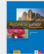
Aspekte junior B2