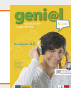
geni@l klick A2