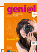
geni@l klick A1